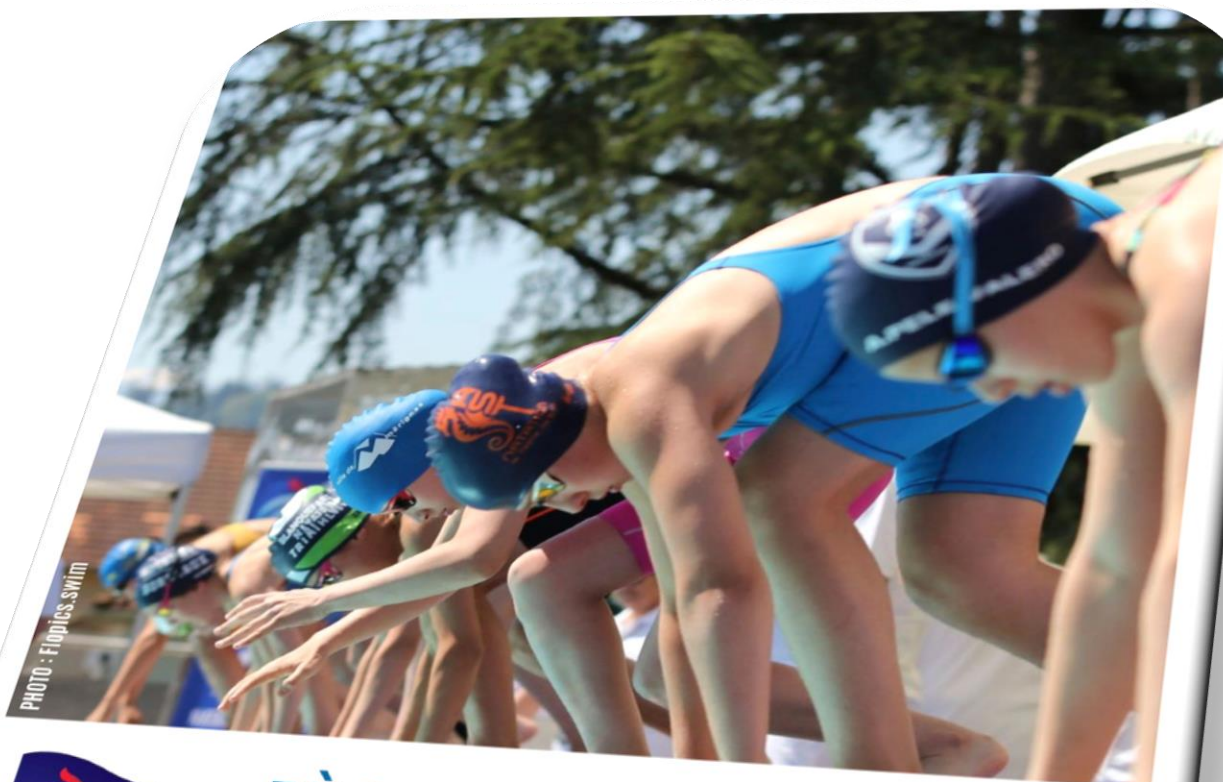
swim